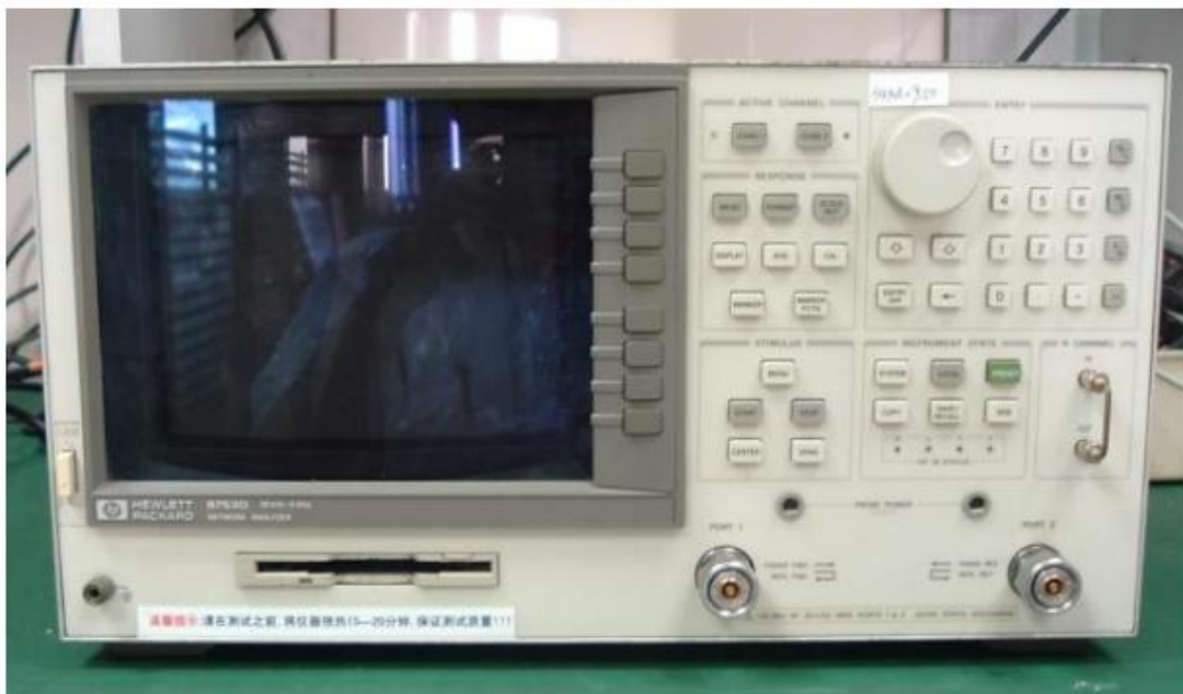
天线测量网络分析仪