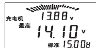
充电系统最高输出