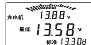
充电系统最低输出

充电系统最高输出图中分别显示当前的测试电压13.88V，标准最高电压15.00V(对于24V系统，标准最高电压为30.00V)，以及测得最高电压14.10V；