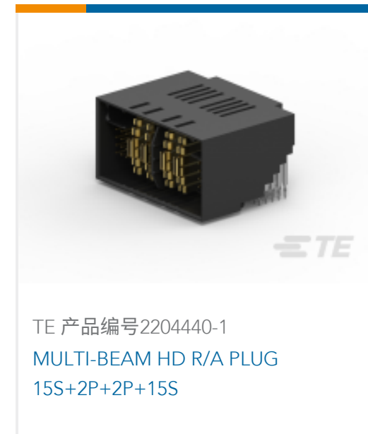
TE 产品编号2204440-1 MULTI-BEAM HD R/A PLUG 15S+2P+2P+15S