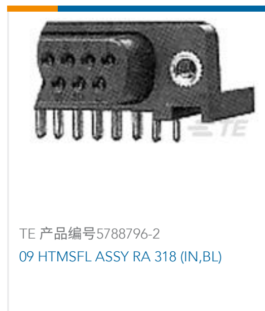
TE 产品编号5788796-2 09 HTMSFL ASSY RA 318 (IN,BL)