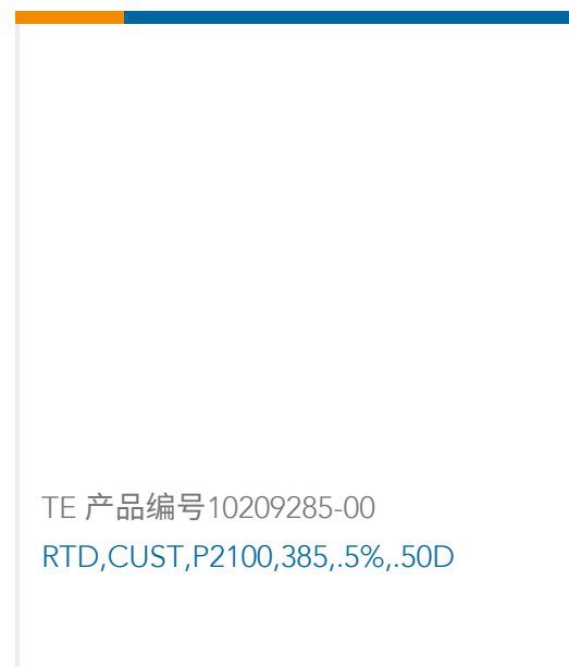
TE 产品编号10209285-00 RTD,CUST,P2100,385,-5%,-50D