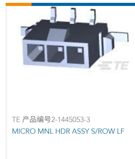
TE 产品编号2-1445053-3 MICRO MNL HDR ASSY S/ROW LF