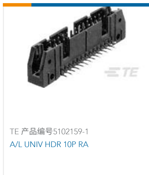
TE 产品编号5102159-1 A/L UNIV HDR 10P RA