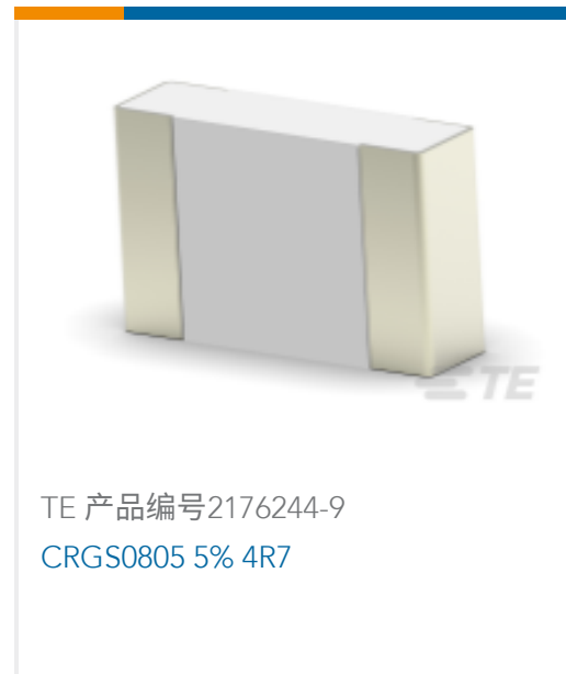
TE 产品编号2176244-9 CRGS0805 5% 4R7