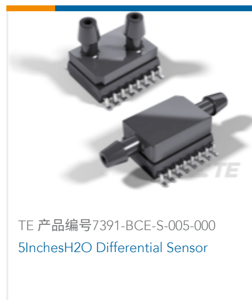
TE 产品编号7391-BCE-S-005-000 5InchesH2O Differential Sensor