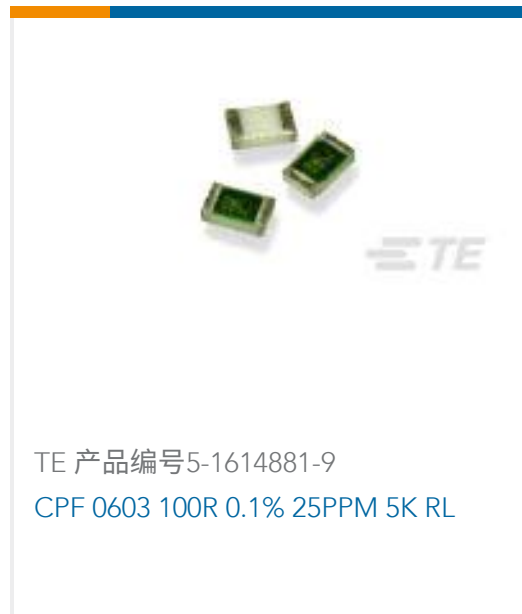
TE 产品编号5-1614881-9 CPF 0603 100R 0.1% 25PPM 5K RL