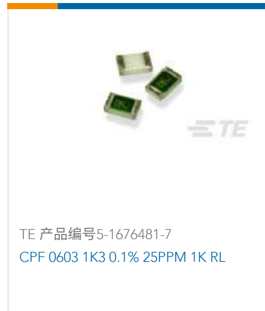
TE 产品编号5-1676481-7 CPF 0603 1K3 0.1% 25PPM 1K RL