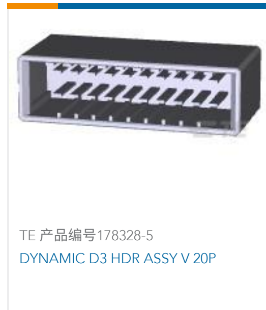
TE 产品编号178328-5 DYNAMIC D3 HDR ASSY V 20P