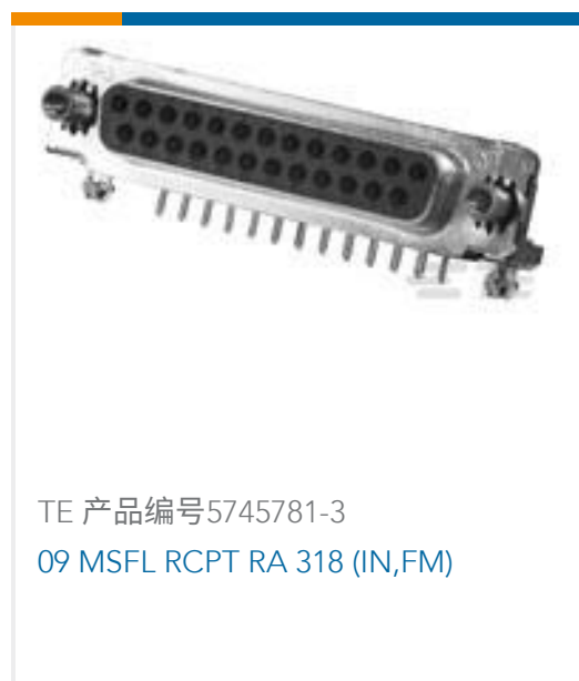
TE 产品编号5745781-3 09 MSFL RCPT RA 318 (IN,FM)