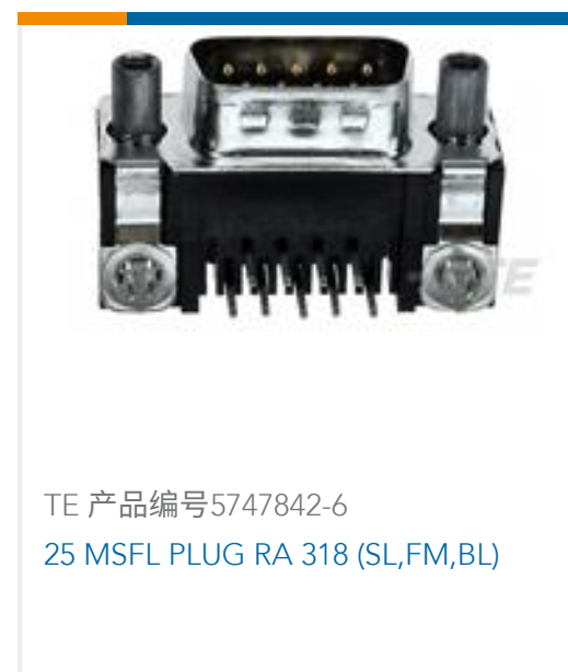
TE 产品编号5747842-6 25 MSFL PLUG RA 318 (SL,FM,BL)