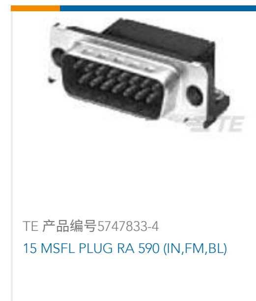
TE 产品编号5747833-4 15 MSFL PLUG RA 590 (IN,FM,BL)