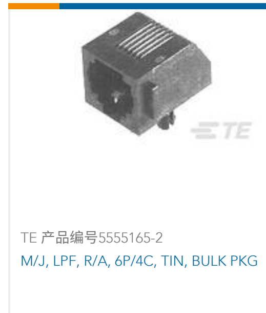
TE 产品编号5555165-2 M/J, LPF, R/A, 6P/4C, TIN, BULK PKG