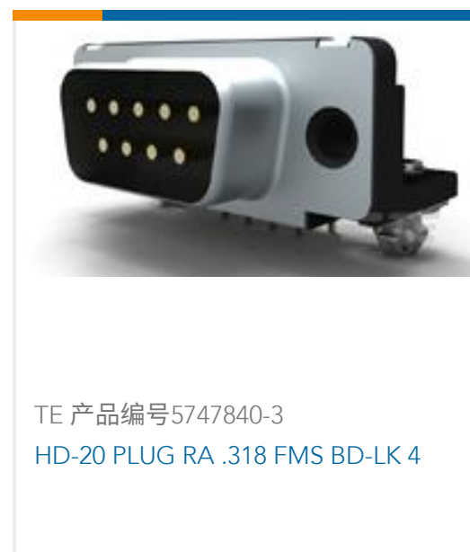
TE 产品编号5747840-3 HD-20 PLUG RA .318 FMS BD-LK 4