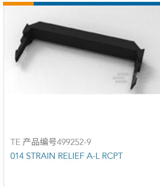
TE 产品编号499252-9 014 STRAIN RELIEF A-L RCPT