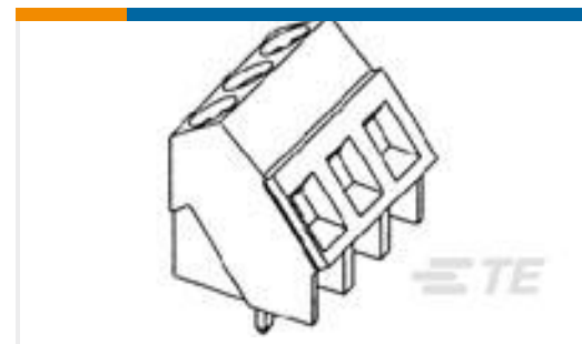
TE 产品编号1546074-5 5 POS 5.08MM TERMI-BLOK TOP WI