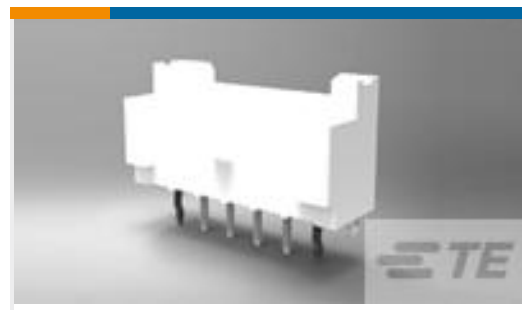
TE 产品编号1744418-7 7 POS EP 2.5 HDR, GLOW WIRE