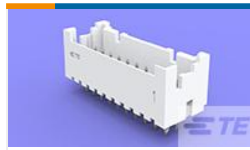
TE 产品编号1-1969570-2 ASSY,HDR,VERT,GWT,BOSSED,DUAL ROW, EP2.5