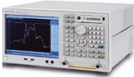
安捷伦 E5071C 网络分析仪