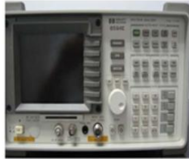
HP 8594E 频谱分析仪