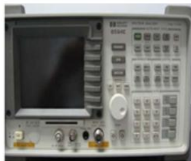
HP 8594E 频谱分析仪