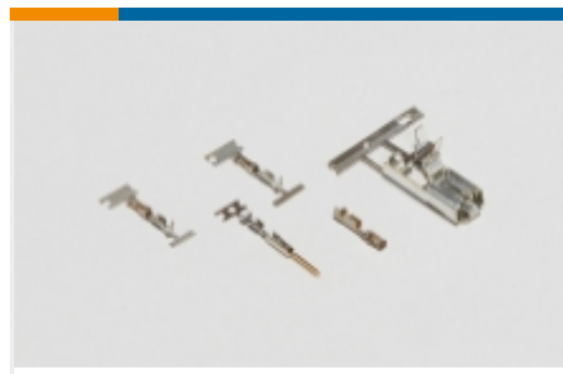
线到板连接器端子(27)