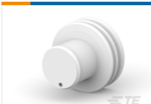
TE 产品编号 1544316-3 BOUCHON BLANC