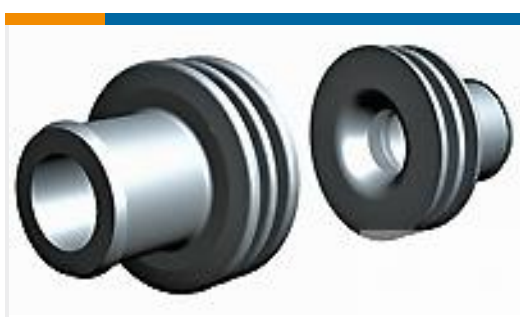
TE 产品编号 1544316-2 JOINT ORANGE G3