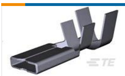
TE 产品编号 1544228-1 CLIP 8 MM NG1-1 G3