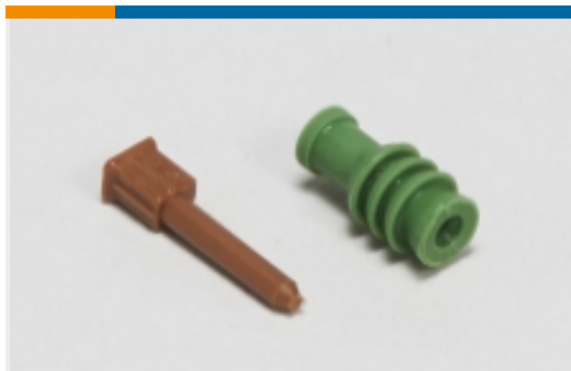
汽车密封件和盲堵(7)