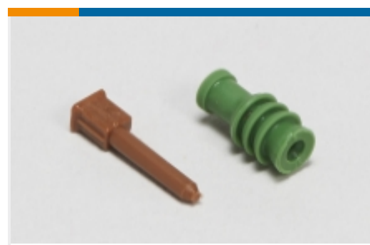
汽车密封件和盲堵(10)