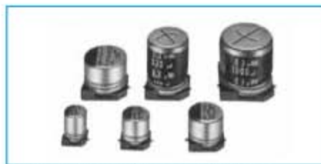
表示色: φ4×5.3L~φ8×6.5L はケース頭部に黒色印刷 φ8×10L~φ10×10.5L は茶色スリーブに白色印刷 φ12.5×13.5L はケース頭部に黒色印刷