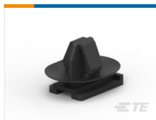
TE 产品编号1-1897255-2 SLOT CLIP FOR J300 / 090 TYPE