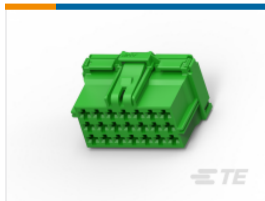
TE 产品编号1897213-2 AMP MCP, 非密封连接器壳体