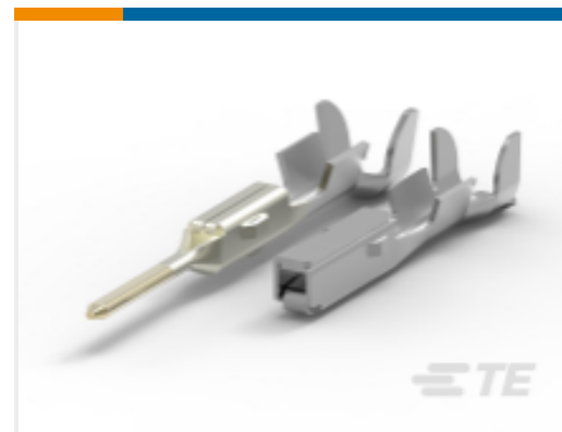
TE 产品编号1743656-1 MULTILOCK, 母端和公端