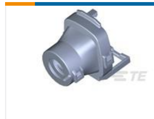
TE 产品编号1-936049-1 COVER HSG FOR E-J PLUG 16P