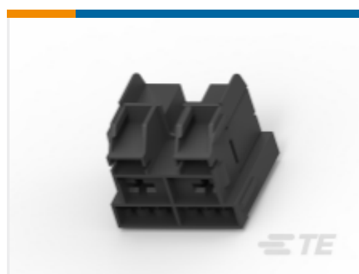
TE 产品编号1380006-1 MINI RELAY SUPPORT