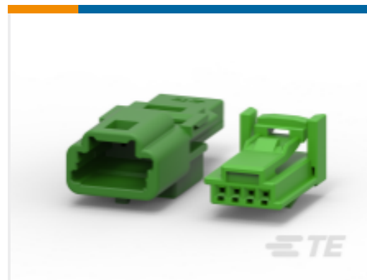
TE 产品编号2109520-1 TH/.025 连接器系统, 壳体