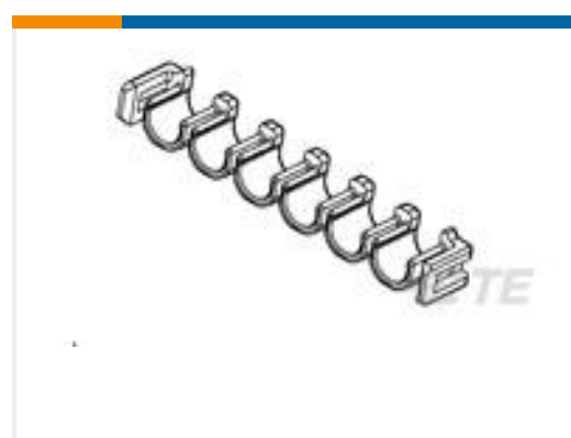
TE 产品编号936397-5 2.8MM SLD 6P PLUG RETAINER YEL