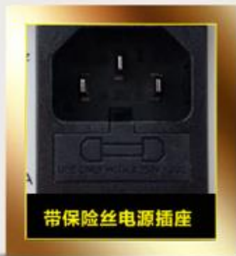
带保险丝电源插座