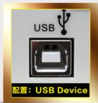
配置: USB Device