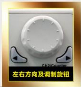
左右方向及调制旋钮