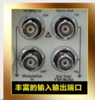
丰富的输入输出端口